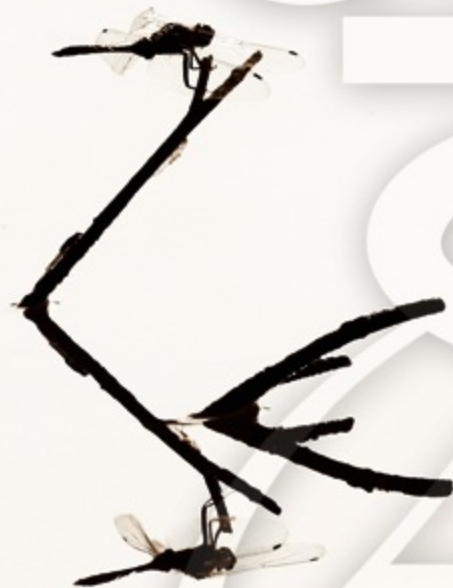
Aquilino Duque Ramírez